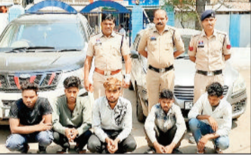
हरिभूमि न्यूज | रायगाढ़

19 साल के युवकों ने पहले गैंग बनाया फिर चोरी का प्लान बनाकर मोबाइल दुकान में उसे अंजाम दिया। पहली चोरी में सफल होने के बाद हौसला बढ़ा और बड़ा हाथ मारने की फिराक में बैंक को टारगेट किया। इसके बाद खम्हार के ग्रामीण बैंक और पटेलपाली के पंजाब बैंक में लूट की नियत से पहुंचे, लेकिन सफल नहीं हो सके। पुलिस के लिए यह गैंग चुनौती बन गया। काफी जटिल जवाबदेह के बाद घरघोड़ा पुलिस को पहले लीड मिली। इसके बाद सीसीटीवी फुटेज का सहारा लेकर गैंग लीडर को पहले पकड़ा। उससे जब पूछताछ की गई तो चोरियों की कड़ी जुड़ती गई। इसके बाद अलग-अलग गांवों से 5 आरोपियों को पकड़ा गया, इसमें एक नाबालिग भी शामिल था। इस गैंग से दो चार पहिया वाहन, 60 मोबाइल सहित लगभग 26.47 लाख की संपत्ति बरामद की गई है।