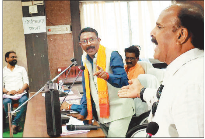
हरिभूमि न्यूज | रायगाढ़

ऐसे किया गया बजट पेश (लाख में) राजस्व आय - 9274.00 राजस्व व्यय - 8549.74 पूँजीगत प्राप्ति - 38762.00 पूँजीगत व्यय - 37262.05 शुद्ध अधिशेष - 2224.21