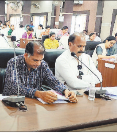
हरिभूमि न्यूज | रायगाढ़

काम बाकी है उसे पूरा किया जा रहा है। इस दौरान शहर में नागरिक सुविधाओं को लेकर किए जा रहे कामों की जानकारी दी। उन्होंने कहा कि 480 करोड़ 36 लाख आय और 458 करोड़ 11 लाख 79 हजार व्यय का बजट पेश किया गया है। ऐसे में इस साल भी बीते साल की तरह 22 करोड़ 24 लाख 21 हजार फायदे का बजट पारित किया गया।