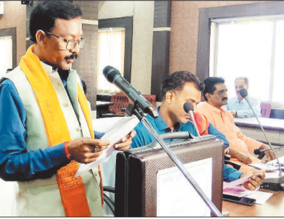
हरिभूमि न्यूज | रायगाढ़

कृषि योजनाओं का लाभ पाने पंजीयन अनिवार्य सक्ती। किसानों को कृषि विभाग की योजनाओं का लाभ लेने के लिए एग्रीस्टेक पोर्टल में पंजीयन कराना अब अनिवार्य कर दिया गया है। जिला प्रशासन और कृषि विभाग ने यह निर्णय योजनाओं का लाभ सही और पात्र किसानों तक पारदर्शी तरीके से पहुंचाने के उद्देश्य से लिया है। शासन द्वारा खाद की बिक्री में पारदर्शिता लाने और विभागीय योजनाओं की सब्सिडी का लाभ सीधे किसानों तक पहुंचाने के लिए एग्रीस्टेक पोर्टल के अंतर्गत किसानों को शत-प्रतिशत "फार्मर आईडी" बनवाने हेतु निर्देशित किया गया है। इसके तहत विभागीय योजनाओं का लाभ केवल जमीन के मालिक या उनके द्वारा अधिकृत व्यक्ति को फार्मर आईडी होने पर ही मिलेगा। वर्तमान में जिले में अब तक लगभग 21147 सक्रिय किसानों का फार्मर आईडी बनाया जाना शेष है।