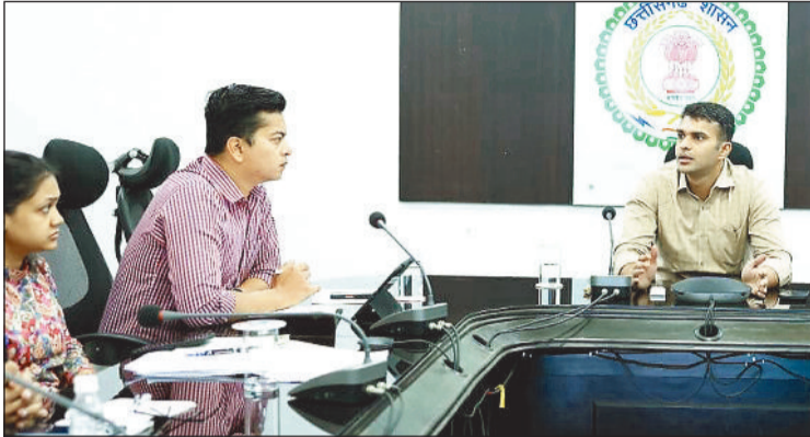
बैठक लेते कलेक्टर।